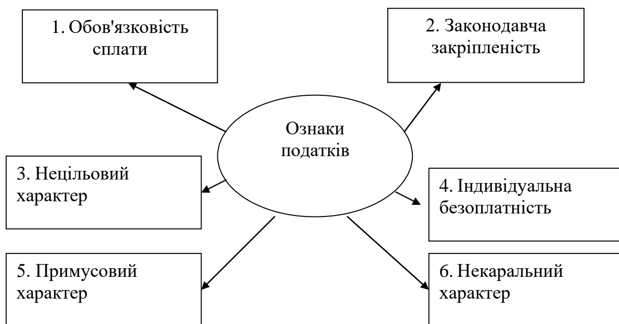
Рис. 1.1 – Ознаки податків як особливого виду державних доходів

Ознаки податків як особливого виду державних доходів. Різноманіття джерел доходів держави зумовлює необхідність визначення того, які з них є податками, а які – неподатковими надходженнями. З цією метою розглянемо характерні ознаки, сукупність яких властива лише податкам як особливому виду державних доходів. Перелік таких ознак наведено на рис. 1.1.